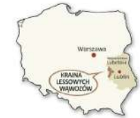
Kraina Lessowych Wąwozów