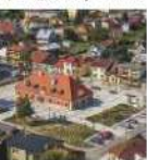
Ratusz w Końskowoli

10 Układ urbanistyczny dawnego renesansowego miasta lokowanego w 1532 r. zmienił się na przestrzeni kilku stuleci. Reprezentacyjną częścią rynku jest ratusz , zbudowany w 1775 roku w stylu klasycystycznym, z fundacji księcia Aleksandra Czartoryskiego, obecnie przeznaczony na cele społeczno-kulturalne. Przy ul. Pożogowskiej zachowały się pozostałości dawnego folwarku Czartoryskich, liczącego ok. 900 ha. Z zespołu dawnych budynków administracyjnych na uwagę zasługuje barokowy spichlerz z poł. XVIII w. (sklep rolny), dawna rządcówka i klasycystyczna holendernia (obora, ob. pasaż handlowy). W tym czasie księżna Izabela z Flemingów założyła wzorcowy ogród róży.