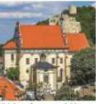
Widok na fortec, zamek i basztę

6 Baszta i zamek , to najstarsze budo-wle strategiczne przełomu XIII/XIV w. Zamek, wzniesiony za czasów Kazimierza Wielkiego, jest dziś roman-tyczną ruiną, z zarysowaną częścią mieszkalną i obszernym dziedzińcem, otoczony wysokim murem. Miasto leży na szlaku architektury renesansu lubelskiego. Przykładem tego stylu jest kościół pw. św. Jana Chrzczciela i św. Bartomeja, pierwotnie fundowany przez Kazimierza Wielkiego, rozbudowany w stylu renesansowym w latach 1610-13 oraz kościół pw. św. Anny i św. Ducha. Obiekty tego stylu wyróżniają się smukłością bryły, bogactwem ozdobnych gzymsów, szczytów zwieńczonych sterczynami oraz stiukowymi dekoracjami wewnątrz.