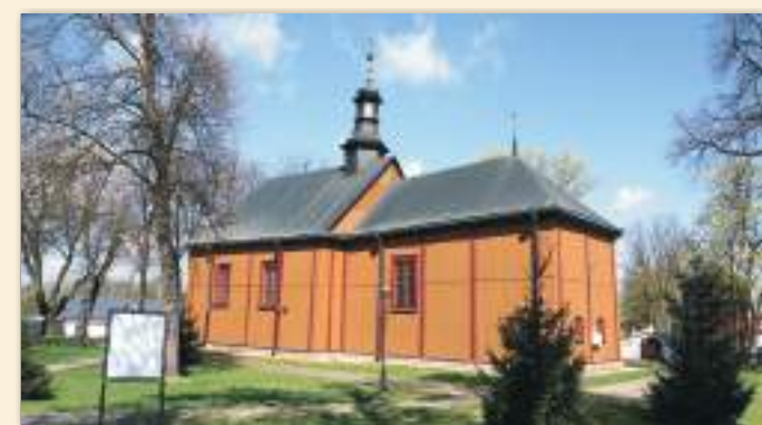
Modrzewiowy kościół pw. św. Teodora (1725 r.) w Wojciechowie