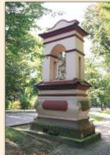
Kapliczka pw. św. Michała Archanioła (XVII-XVIII w.)