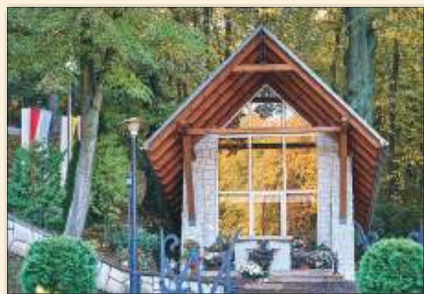
Kapliczka Matki Bożej Kębelskiej w Kębło