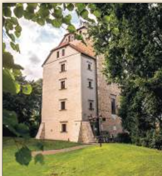
Wieża Ariańska z 1520 r. w Wojciechowie