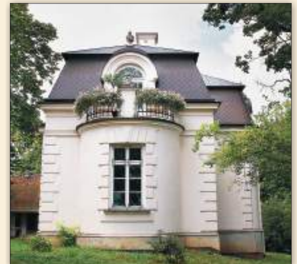
Willa „Pod Kraszewskim” zbudowana w stylu włoskim pod koniec XIX w.