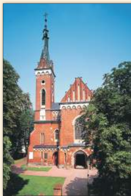
Kościół w stylu neogotyckim (1914 r.) w Wąwolnicy