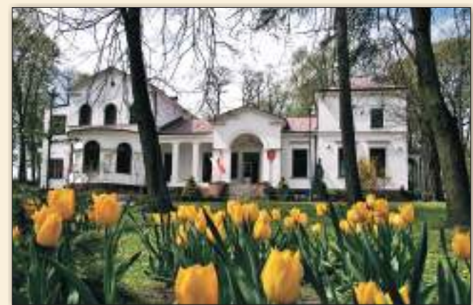
Zespół pałacowo-parkowy w Kębło