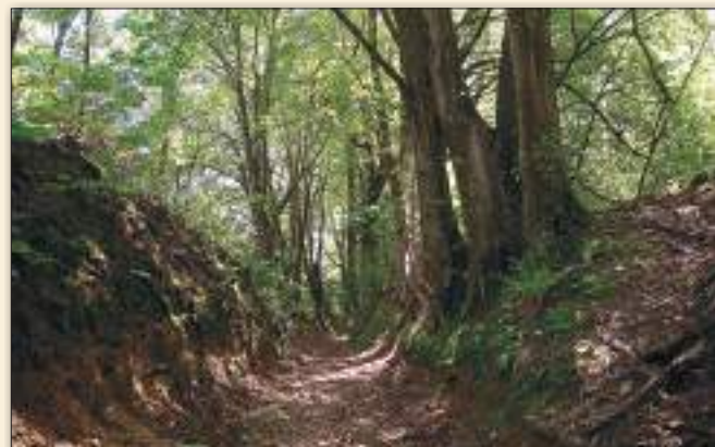
Wąwóz w Lesie Bochońnickim