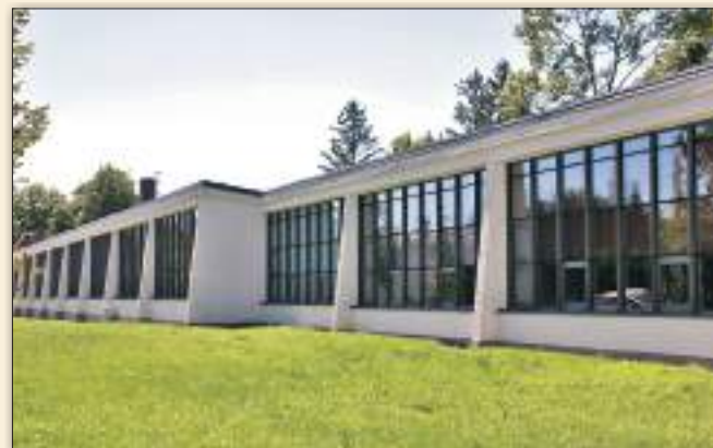
Liceum Plastyczne im. Józefa Chełmońskiego (rok budowy 1966 r.)