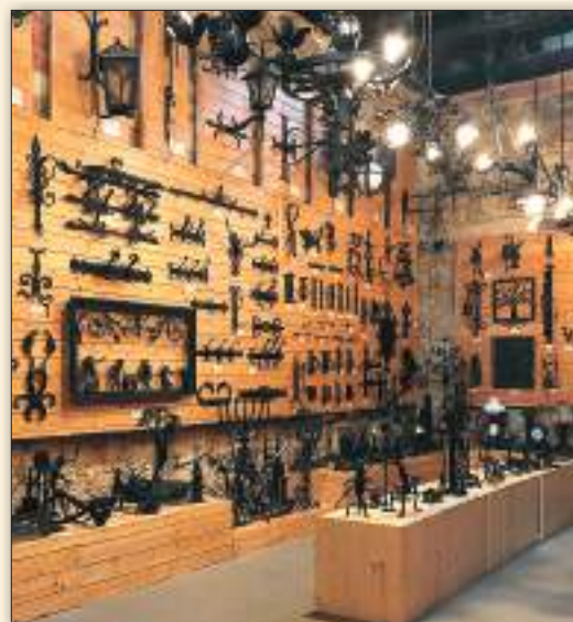
Muzeum Kowalstwa w Wieży Ariańskiej